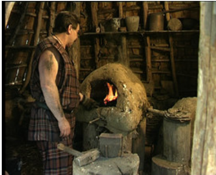
Reconstitution historique d'une forge celtique