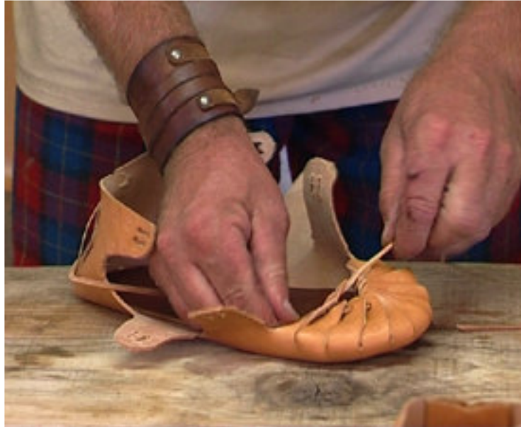
Fabrication de chaussures

Les auteurs grecs et romains de l'Antiquité ont dépeint les CELTES comme des « barbares », des cavaliers intrépides et sauvages et des chasseurs de tête. Mais autant que des guerriers, les Celtes furent des mariners hardis, des paysans habiles, des artisans de précision, des charpentiers, des céramistes et des orfèvres réputés.