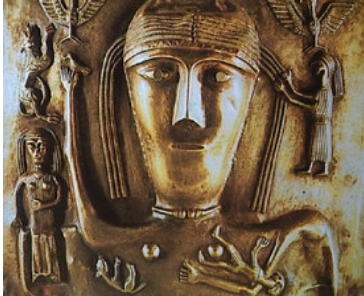
L'or des celtes

Les progrès accomplis depuis quelques années par la science ont permis aux archéologues d'en savoir plus sur cette prestigieuse civilisation et de mener des recherches approfondies.