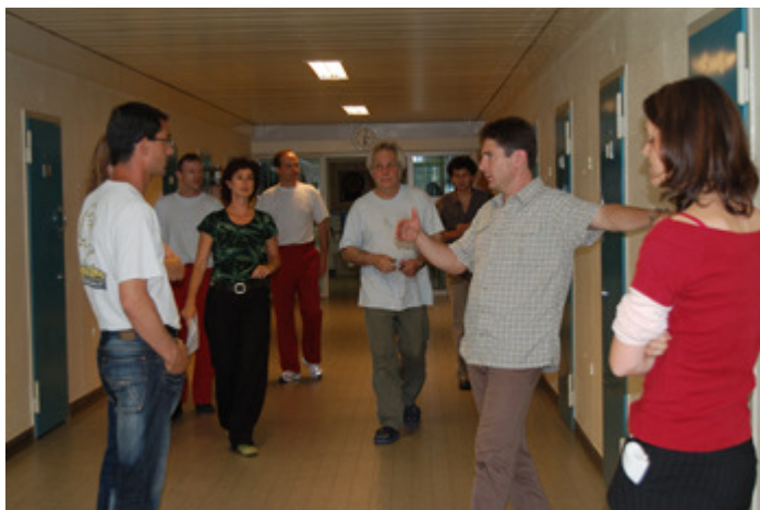
Tournage du film « Bernhard pourquoi Bernhard »

La prison, on n'en sort pas indemne. Au fil des mois, nous avons tous le sentiment de vivre l'incarcération dans notre chair. Quand nous étions séparés de l'extérieur par neuf portes fermées à clé, nous devions lutter contre la peur que ça prenne feu par exemple. Et accepter de dépendre du bon vouloir des gardiens. Sacrée école de la dépendance ! Cela dit, c'était une expérience passionnante. Ce n'est pas la première fois que je fréquente ce monde-là, c'était déjà l'objet de mon premier documentaire « Mon père cet ange maudit » en 1994. La prison, ça vous mobilise ici et maintenant, et ça vous confronte à des questions essentielles. Cette expérience m'a confortée dans ma conviction qu'il est indispensable de donner la parole à ceux qui ne l'ont pas et qui peuvent témoigner à la première personne « Je ». Et aussi j'ai besoin de croire que tout le monde peut changer, même des condamnés à de lourdes peines. Leur amener des outils créatifs tel que le cinéma favorise ce changement, et je ne me lasse pas de me battre pour que ce type de projets prolifère.