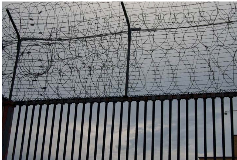
Etablissements pénitentiaires de la Plaine de l'Orbe

En amenant la culture en prison , nous partons du principe que la pratique d'activités créatrices est un outil puissant de valorisation de soi et de re-construction. Une oeuvre d'art de qualité montrée au public permet à son créateur de renouer avec le monde environnant dans un sentiment de fierté et de dignité. En un mot, l'action créatrice peut fournir l'énergie du rebond à des personnes que la vie a abîmé et qui sont momentanément en difficulté.