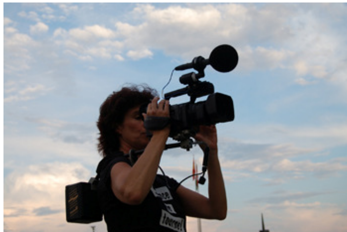
Denise Gilliland, réalisatrice

C'est une situation inconfortable pour un cinéaste et surtout c'est une énorme prise de risque pour le producteur: jusqu'au bout, on n'est pas sûr de pouvoir sortir le film! C'est d'ailleurs pour cette raison que j'ai produit moi-même ce documentaire. Finalement, il n'y a pas eu d'images auxquelles j'aie dû renoncer. J'ai pu sortir le film sans avoir à le modifier.