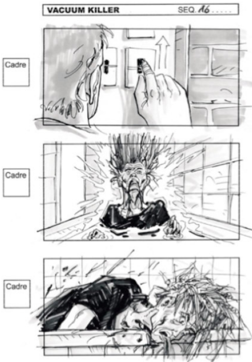
Le suicide de la mère de Chris