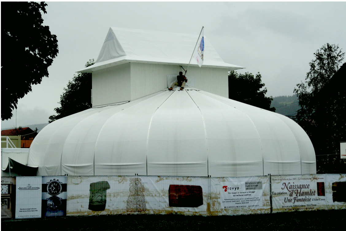
Le Théâtre construit pour la pièce

Et finalement, au mois de janvier, j'ai décidé de me lancer: c'était le moment ou jamais. En effet les répétitions commençaient, et parallèlement on entamait la construction du théâtre.