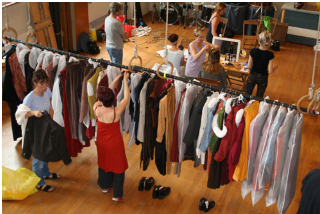
Essayage des costumes